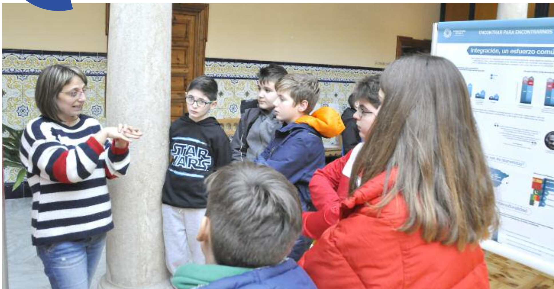
Un grupo de escolares de Calamocha realizaron ayer una visita guiada a través de la exposición de Cáritas 'Encontrar para encontrarnos'. M. A.