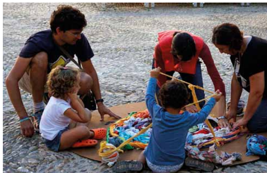
Con los niños en Mosqueruela