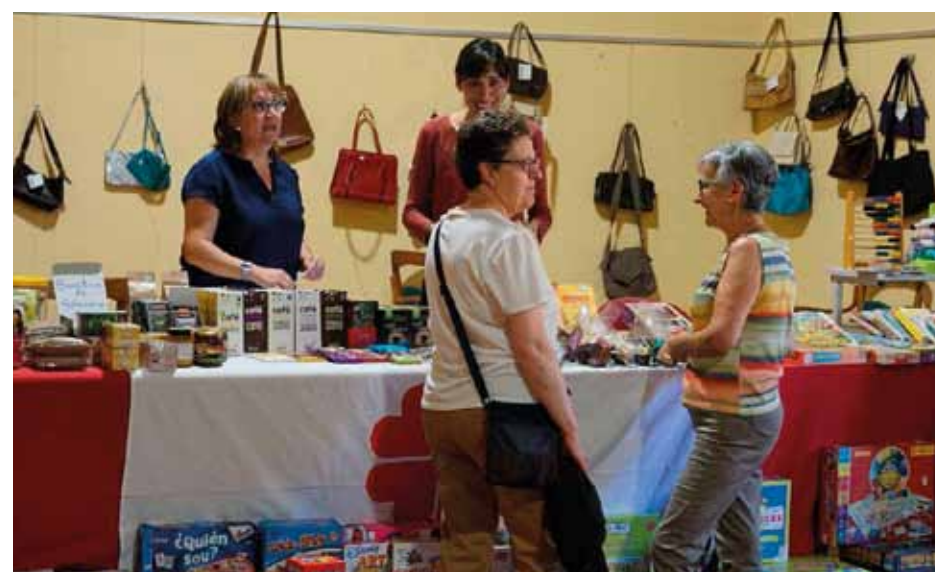
Comercio Justo en Mosqueruela

con corazón, de la que el grupo es responsable, así como la importancia de los valores para una buena convivencia en nuestro día a día. Valoramos esta actividad, en la que se han implicado todas las voluntarias, como muy enriquecedora, ya que ha habido una gran participación y colaboración por parte de niños y adultos que compensa el esfuerzo por parte de todas.